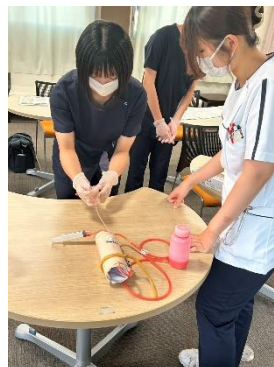
高校生/中学生ナース体験