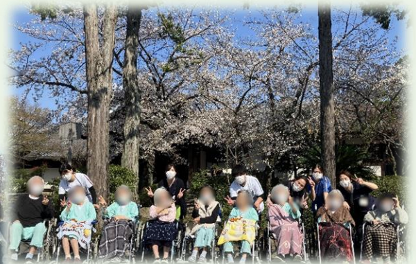
近所の桜スポットでお花見🌸