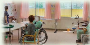
皆でリハビリ体操！