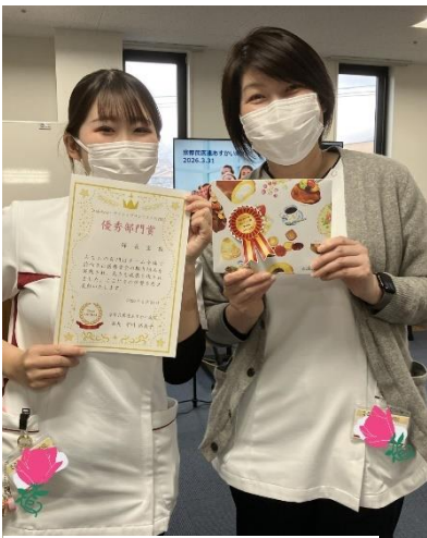
優秀部門賞の賞状と景品 持ってパシャリ☆

2025年度の締めくくりとなる3月31日、あすかい病院恒例の「Safety-2 ポジティブコンテスト」が開催されました！このコンテストは、1年間のポジティブな取り組みを共有し合い、みんなで元気に新年度を迎えようというイベントです。各職場から、①仕事・環境改善の取り組み、②業務の効率化、③コスト・労力削減、④サービス向上、⑤学習・教育制度の改善、⑥円滑なコミュニケーションの充実、⑦エラーやインシデントへの先行的対策事例の7項目についてエントリーを募ります。この日発表したのは、私たち看護部（師長室）の他に、リハビリテーション部、栄養課、臨床工学課、緩和ケア病棟。どこの部署からも日々の業務の中で多くの知恵と工夫がなされてきた報告がされ、お互いに学びあい刺激しあえる機会となりました！